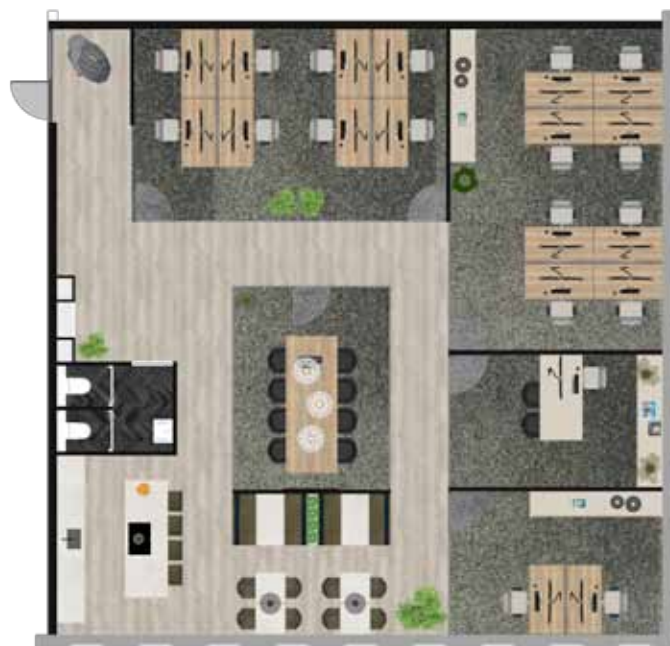
Bovenstaande tekening is een voorbeeldindeling gebaseerd op unit 18.