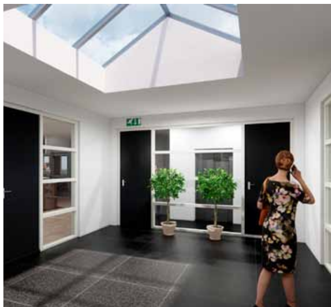
Bovenstaande impressie geeft de entree op de tweede verdieping weer.